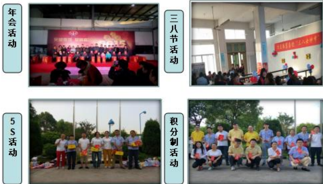
丰富多彩的文体活动

公司除了生产上的安全关注，公司也十分重视员工的文化建设和健康。这主要体现在我们努力为员工创造舒适的工作环境和生活环境，如办公室和车间、食堂和宿舍、运动和休闲、阅读及娱乐等等。除了硬件保障之外，我们还通过诸如劳动技能竞赛、员工聚餐和文娱活动等员工活动来调动员工的工作激情，丰富员工的业余生活，获得了员工的广泛好评。如下图：