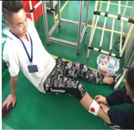
图 6.3-01 2021 年火灾应急演练记录