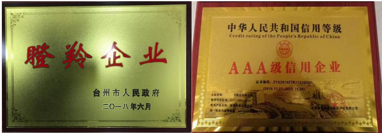
图 3.3-1 社会认可荣誉证书（示例）

牌、重质量守诚信优秀示范单位和 AAA 级信用企业等，同时也明确要求供应商等相关方遵守法律法规诚信经营，如图 3.3-1 所示：