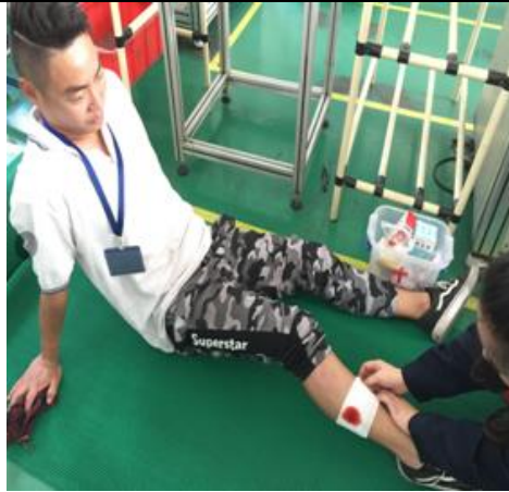
图 6.3-01 2019 年火灾应急演练记录