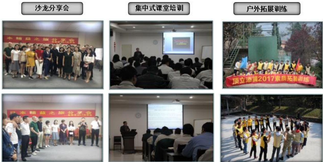
图 3.2-1 各类培训活动

京长松文化传播有限责任公司到公司授课，开展技能、质量、营销、管理、战略、企业文化等多方面的学习培训，常年参加学习培训的顶立添翼员工达 500 多人次。公司制定了《培训管理规定》，并对获得高学历、高级、中级职称的在职人员，分别给予相应的资金奖励。